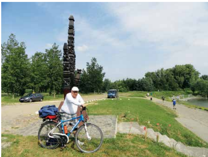
Zentán, az 1944. november 9-én ártatlanul kivégzett magyarok kopjafájánál 2018-ban