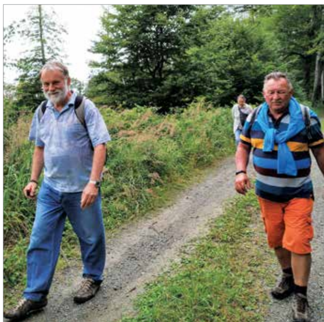
Szép volt a környezet, sok régi határkövet találtak