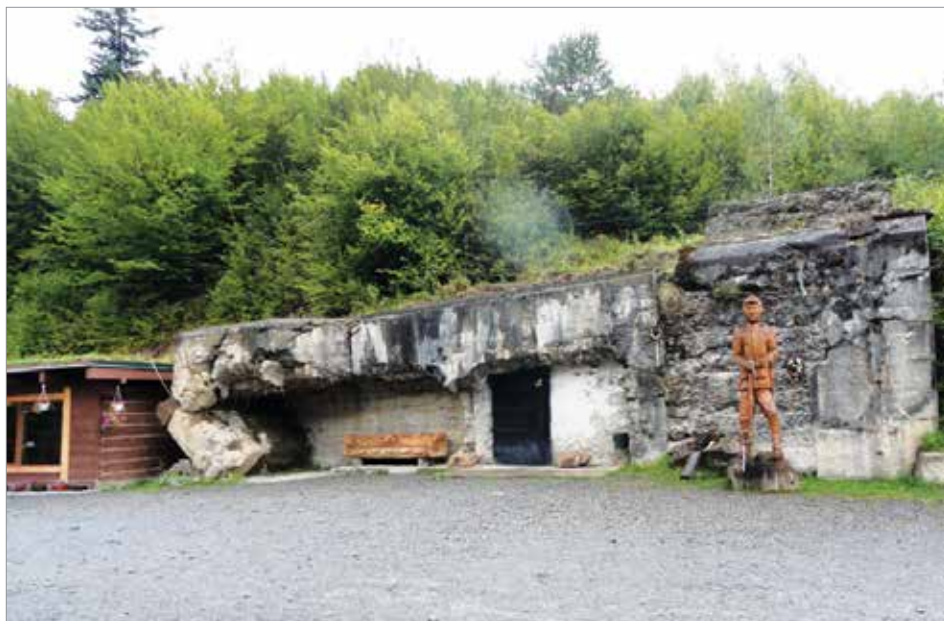
Az Árpád-vonal mentén 2018-ban