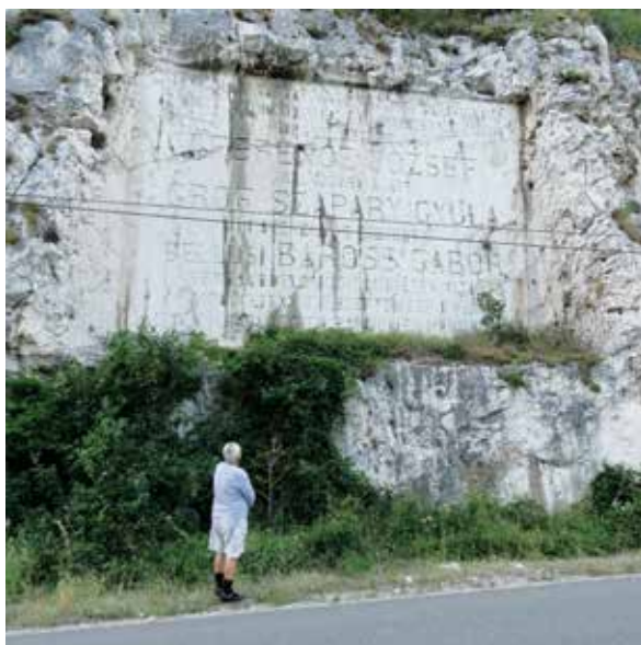
A Baross-tábla a Vaskapunál 2017-ben