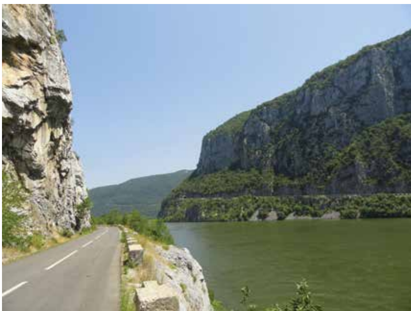
A Vaskapu 2017-ben