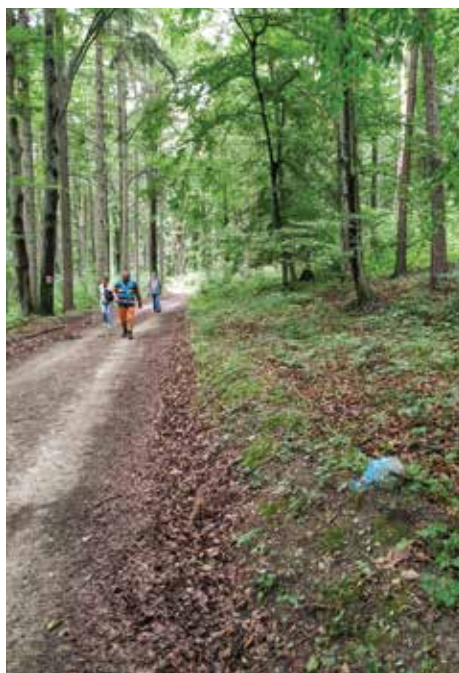
Kellemes gyaloglás a volt Monarchia két országa közötti határon