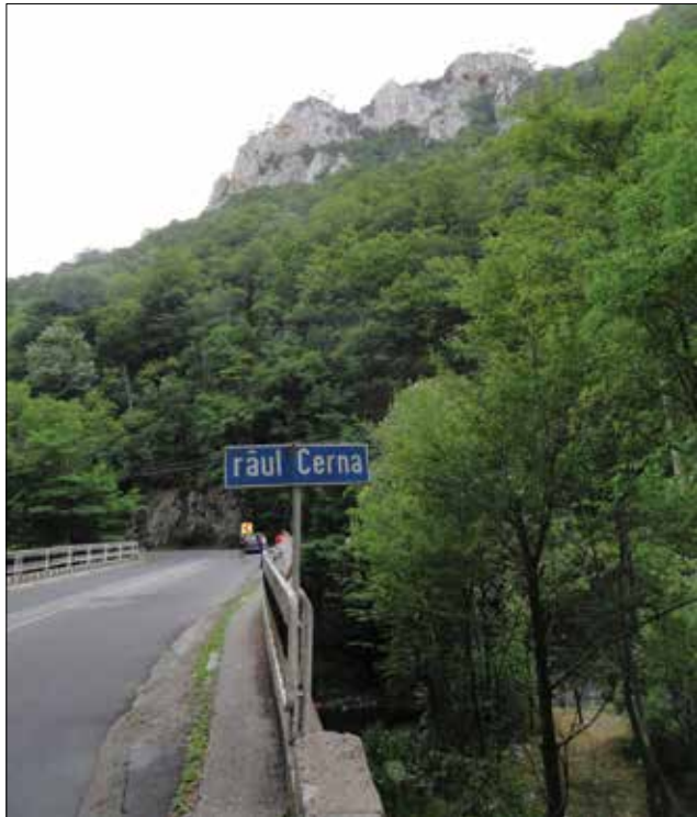
A Cserna-folyó szurdokának keleti hegygerincén húzódott a határ a Magyar és a Román Királyság között