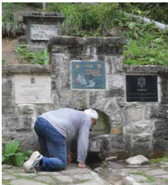
A Tisza forrásánál 2016-ban