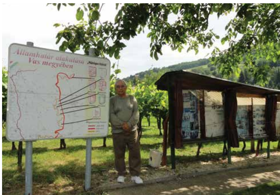
Felsőcsatáron a Vasfüggöny Múzeumban 2017-ben