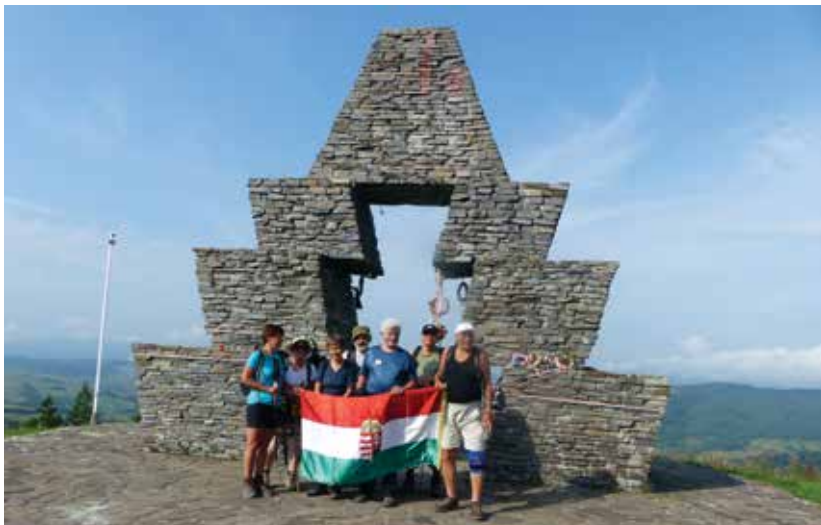
Az ezer éves határ felderítése közben a Vereckei-hágónál 2019-ben