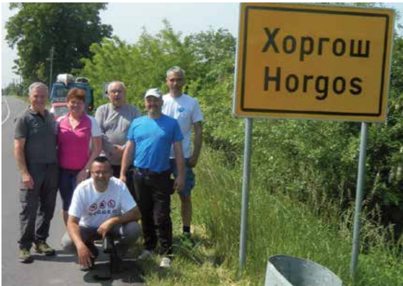
A Tisza mentén Horgostól Titelig 2018-ban