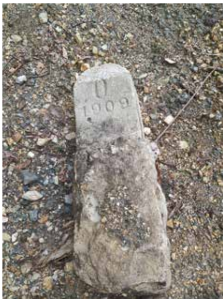
Határkövek az Osztrák Császárság és a Magyar Királyság határán