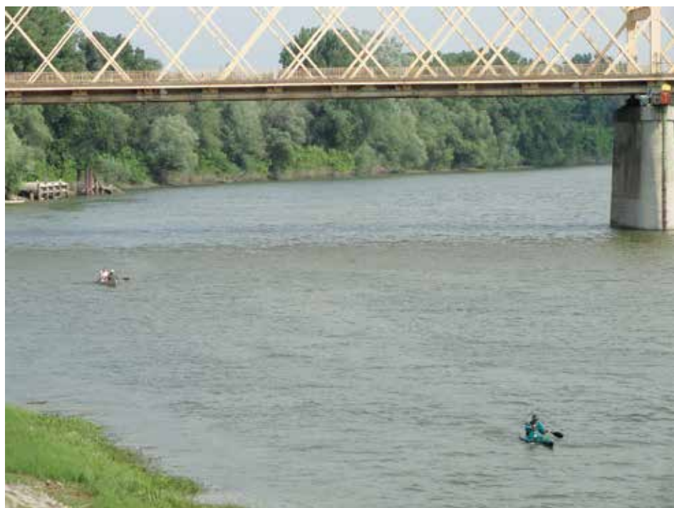
A társaság kajakos része Zentánál a Tiszán 2018-ban